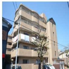
グランドヒルズ翔 [2LDK] [神宮東]