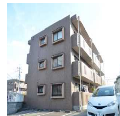
ユーミー青柳2号館 [3DK] [花山手東]