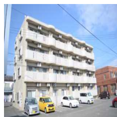
ユーミースマイル [2LDK] [島之内]

梅雨に入り、物件調査も遅くなりがちです。でも、雨の日の物件確認も実は重要だったりします。階段周り、エントランス、駐車場からのアクセス等、入居後に「失敗した～」とならないように注意しましょう！。いろんな条件変更が出る時期です。今回はキャッシュバック有りのお部屋をご紹介しましたが、短期解約違約金があるので、異動の可能性のあるお客様にはオススメしません。