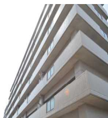
パストラル柳丸 I [3LDK] [柳丸町]