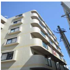
TY II [1R] [江平中町]