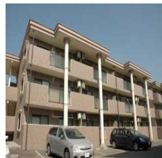
リングマンション [2LDK] [本郷北方]