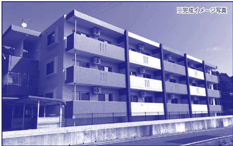
※完成イメージ写真