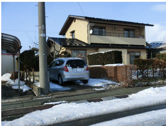
南面道路で日当たり良好。家庭菜園有り!