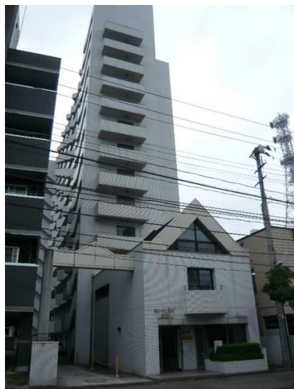
市内中心部 オーナーチェンジ物件