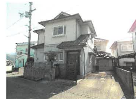
※リフォーム前外観