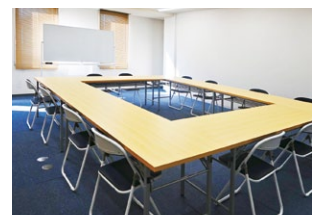
503 5~12名さま向け 約31㎡