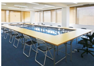
502 20~40名さま向け 約60㎡