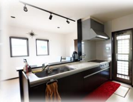
★キッチンから洗面、浴室へも動線が使いやすいです!