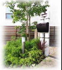
★↑玄関前のシンボリックツリーが家の印象をアップさせています。