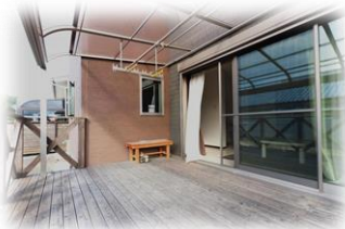
★写真じゃわかりにくいですがリビングから続くひろびろデッキもおすすめ!