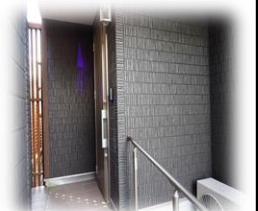
★↑玄関一歩も注文住宅ならではの仕上り