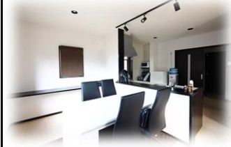
★リビングと程よく独立させダイニングキッチン 会話盛り上がり♪