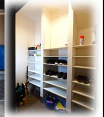
★↑大容量のシューズクローゼットに収納できて大助かり