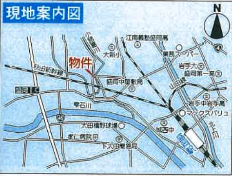
【カーナビ案内:岩手県盛岡市大館町14付近】 ※チラシ作成時、住所掲載不可。

JR東北本線「盛岡」駅下車 「盛岡駅西口」乗車12分 岩手県交通バス「大館児童公園口」徒歩4分