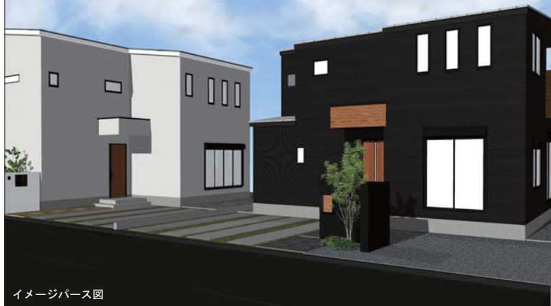
イメージパース図