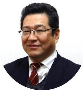
株式会社上原不動産 代表取締役

ぜひ一緒に、「2020年、変わりゆく世の中で、成功する賃貸経営」を考えていきましょう。