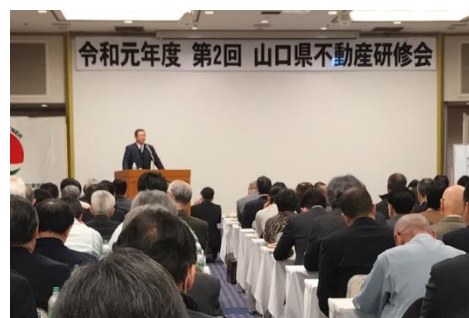
ハトマーク山口県支部主催のセミナーに登壇