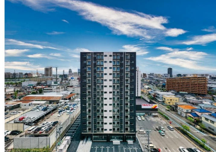
※2023年5月24日 ドローン撮影