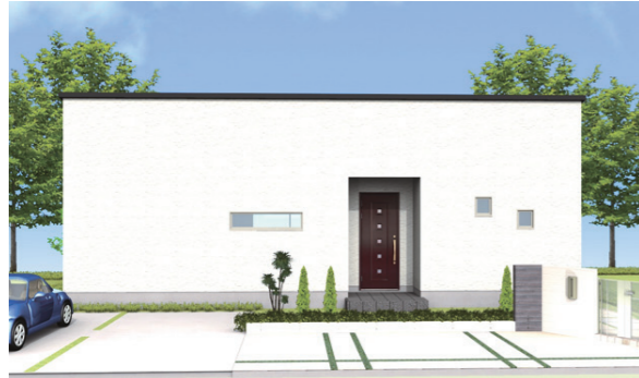
Plan 36 1,110万円 北入り玄関 延床面積 / 73.70㎡ (22.29坪) 施工面積 / 77.01㎡ (23.29坪)