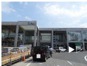
①延岡駅を出ます。そしたら左折。