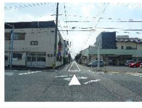
③横断歩道を渡り、そのまままた150m直進。