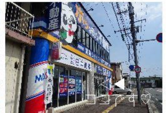
④左手にパンダのマークが見えてきます。そちらが「日中商事」です。