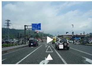
②五ヶ瀬大橋を渡って、1個目の信号を右折。