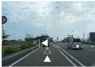
①延岡インターを降り、そのまま直進。1個目の信号を左折。

延岡インター降りて 1個目の信号を左折 五ヶ瀬大橋を渡って、1個目の信号を右折 そこから1, 6 km直進 パンダのマークの外観が左手に見えます。 そこが「日中商事」でございます。