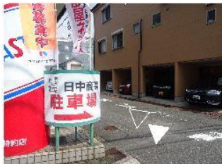
⑤駐車場は、事務所過ぎてすぐを左折。少し直進。