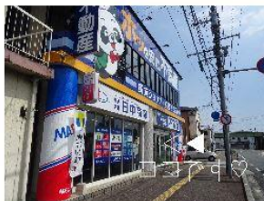
⑤そのまま直進して徒歩1分。左手にパンダのマークが見えたら、そちらが「日中商事」です。