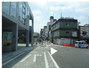
②左手に交番が見えます。そのまま350m直進。