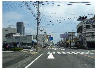
③そのまま1, 6 km直進。