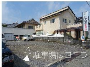
⑥事務所裏手に駐車場がございます。