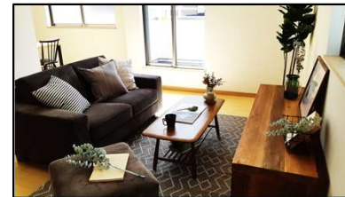
※イメージ家具展示中