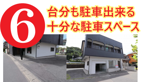
(サイズによっては6台以上駐車可)