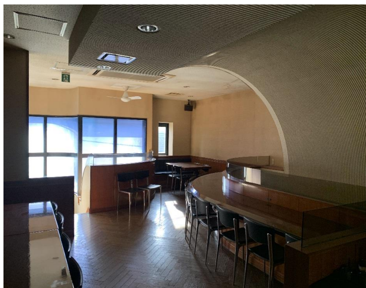
図面と現況が相違する場合は現況を優先します。